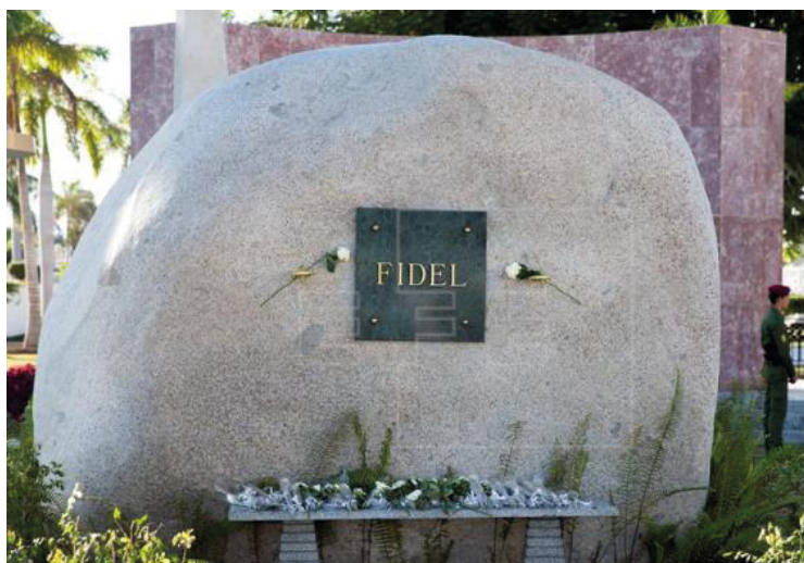
Símbolo de la fortaleza sin fisuras de sus principios, una sencilla roca se convirtió en la tumba de Fidel

Una convicción que sería simple indignación im-