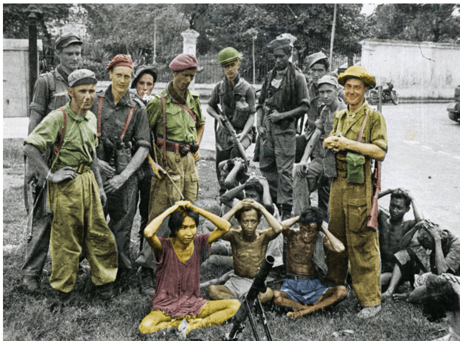
Holanda también cometió crímenes de guerra y violencia en masa durante la lucha por la independencia de Indonesia.

e internacionalista -paradójicamente-, Henk Sneevliet (Maring), funda en 1914 la Asociación Socialdemócrata