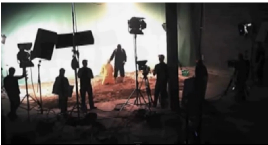
Puesta en escena de una de las decapitaciones.