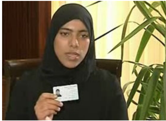
Foto real tras su supuesta muerte.

Otro ejemplo sangrante y burdo: las imágenes de las "masivas manifestaciones" contra el gobierno del presidente sirio grabadas en Damasco y Alepo, que en realidad eran manifestaciones a favor del gobierno, pero debidamente editadas y formateadas se hicieron pasar por su contrario.