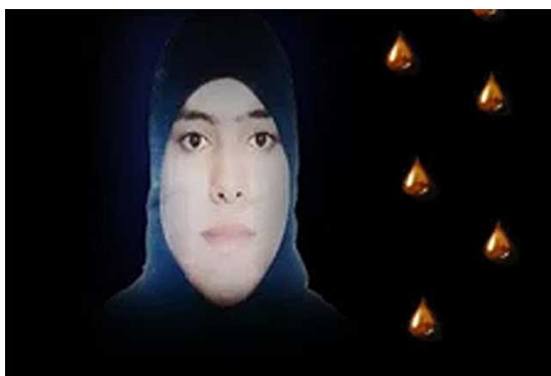
Zeinab al -Hosmi: decapitada mutilada y despellejada en una cárcel siria. Diario el Mundo 25/09/2011

Desde el inicio del conflicto en Siria la desinformación ha sido una cuestión central. La cobertura mediática fue inmediata. No es ajeno el hecho que desde el 2009 mucho antes del inicio de la “Revolución Siria” se hubieran introducido más de 1000 móviles vía satélite con un valor individual superior a los 1000$ (el total de la operación superó el millón de dólares financiado por el Departamento de Estado de los Estados Unidos) los aparatos fueron distribuidos a personas entrenadas para utilizarlos. 4 La relación de mentiras, falsificaciones o tergiversaciones llenarían una enciclopedia. Cabe recordar como ejemplos el caso de la primera gran “mártir” de la oposición siria: el caso de Zainab al Hosni, asesinada y descuartizada, según la oposición, por la policía siria y aparecida viva posteriormente en la TV. 5 La noticia fue facilitada por Amnistía Internacional y Human Rigths Watch. Una vez aparecida con vida. Las organizaciones no rectificaron ni se disculparon.